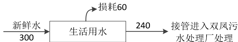
图 4-2 本项目水平衡图 单位：t/a