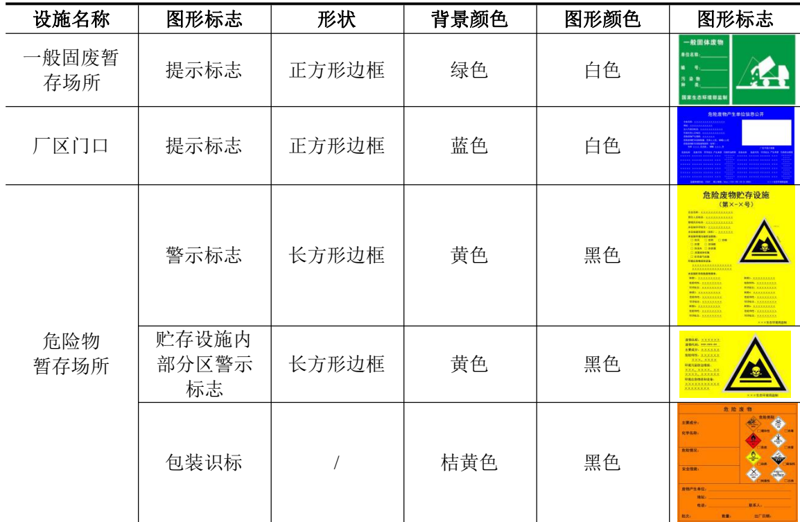
表 4-23 固废堆放场的环境保护图形标志一览表

根据《环境保护图形标志固体废物贮存（处置）场》（GB 15562.2-1995）设置环境保护图形标志。本项目固废堆放场环境保护图形标志的具体要求见下表：