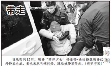
当地时间 12 日，瑞典“环保少女”格蕾塔·桑伯格在瑞典议会外抗议示威，要求采取气候行动，随后被警察带走。(视觉中国)

当地时间 12 日，波兰总统杜达与总理图斯克一起访问白俄罗斯，呼吁北约盟国大幅增加国防开支，并向华盛顿施压，以期打破为乌克兰提供援助资金的僵局。据悉，欧盟国家将同意向一个用于资助乌克兰运送军事物资的基金追加 50 亿欧元。土耳其总统埃尔多安周二警告称，必须避免任何加剧俄乌冲突并可能将冲突蔓延至北约的措施。另外，埃尔多安还表示，将在本月底或下月初与普京见面。▲