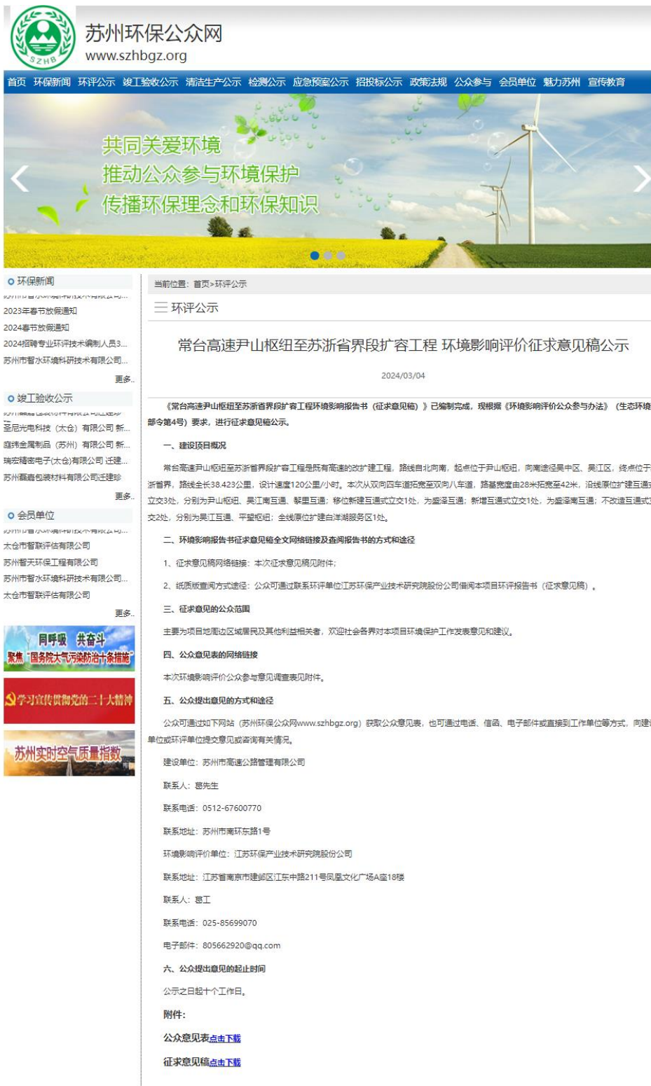
图 3.2-1 征求意见稿公示截图