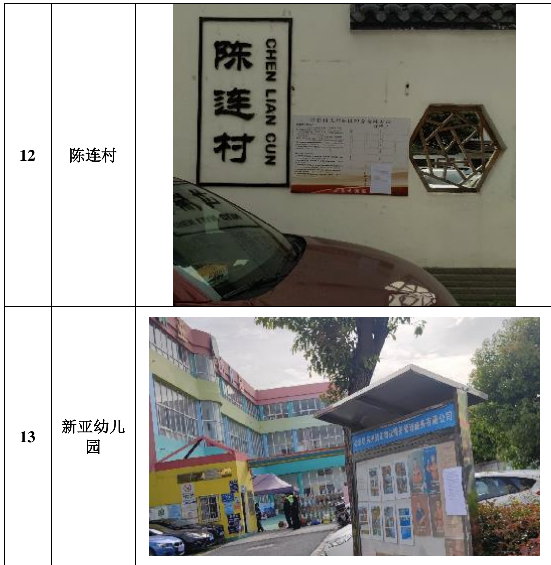
图 3.2-3 现场张贴公告照片