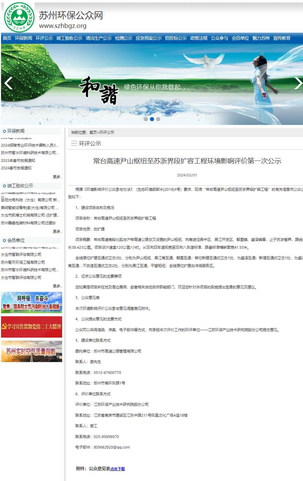
图 2.2-1 苏州环保公众网公示截图